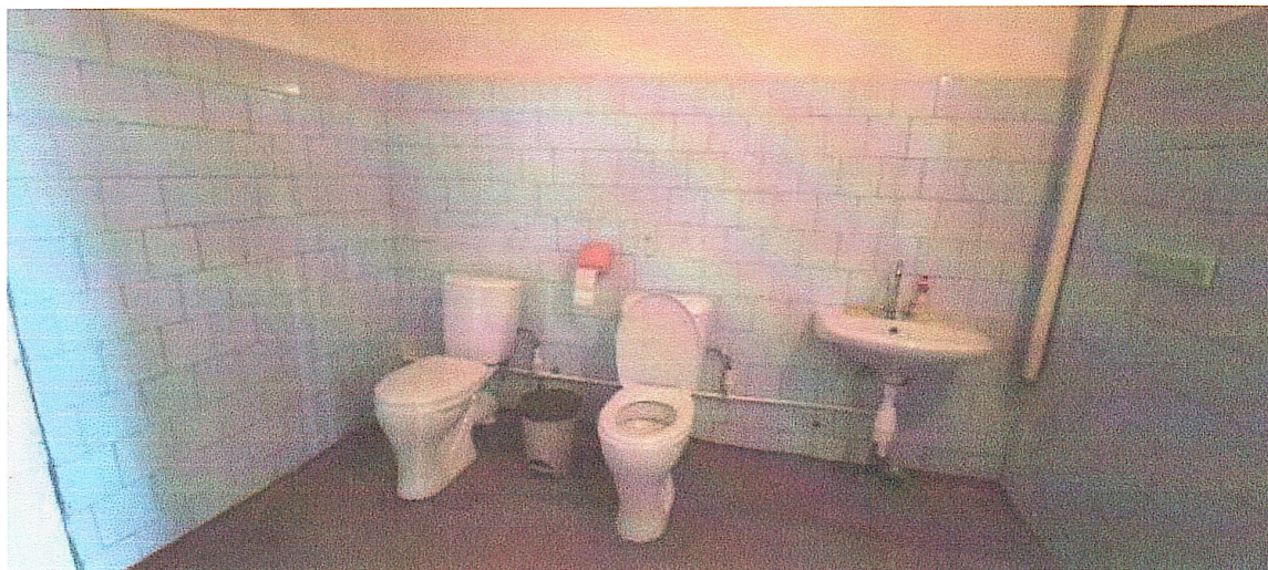
Рис. 2 Визуализация будущего проекта.

7. 3 графических изображения, включающих Рис. 1 Состояние объекта «До».